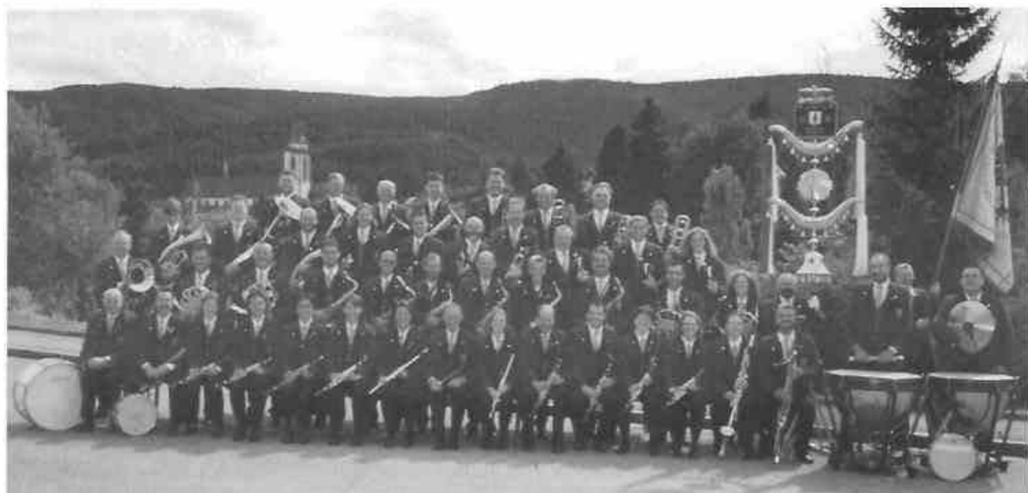
Stadtmusik Neustadt im Schwarzwald