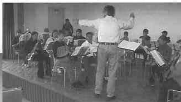
Die JMF im Trainings- lager vor ihrem Jahreskonzert im Januar 2002.

Nach dem Probeweekend wollten wir alle ein bisschen ausruhen und uns von den anstrengenden zwei Tagen erholen. Doch dazu blieb keine Zeit. Bereits am kommenden Mittwoch trafen wir uns wieder zur Probe und versuchten, all das Gelernte umzusetzen. Für eine Pause blieb uns keine Zeit. Und auch die normalerweise eineinhalb Stunden Probe wurden zu fast zwei Stunden. Jeder hat jetzt auch gemerkt, dass die Proben nicht zum Üben da sind, sondern dass man sich zu Hause die Stücke anschauen sollte. Jeder gab während den Proben sein Bestes und man erkannte sehr schnell Fortschritte. Das Konzert näherte sich. Mit jeder Probe stieg die Spannung und man fragte sich, ob auch alles klappen würde. Schliesslich wird es unser zehntes Jubiläum sein. Daher haben wir auch von jedem Jahr ein Stück ausgewählt.