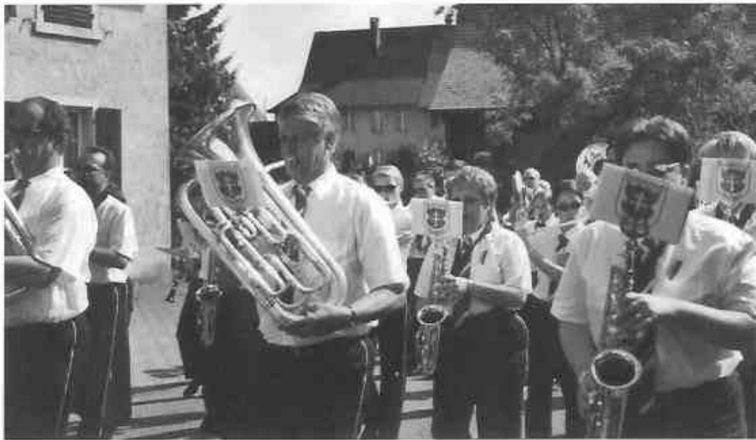
◁ Konzentrierte Musikantinnen und Musikanten beim Marschmusikvortrag.