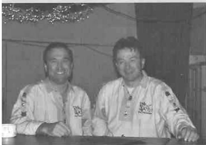
Das Duo Firebird und Dynamite sorgten mit den Gini's für das Wohl der Gäste an der Bar.

Um Mitternacht wurden dann die von einer Jury ausgewählten Masken prämiert und nach der Demaskierung hiess es, so richtig heiter weitertanzen und Spass haben mit den Ohrwürmern.