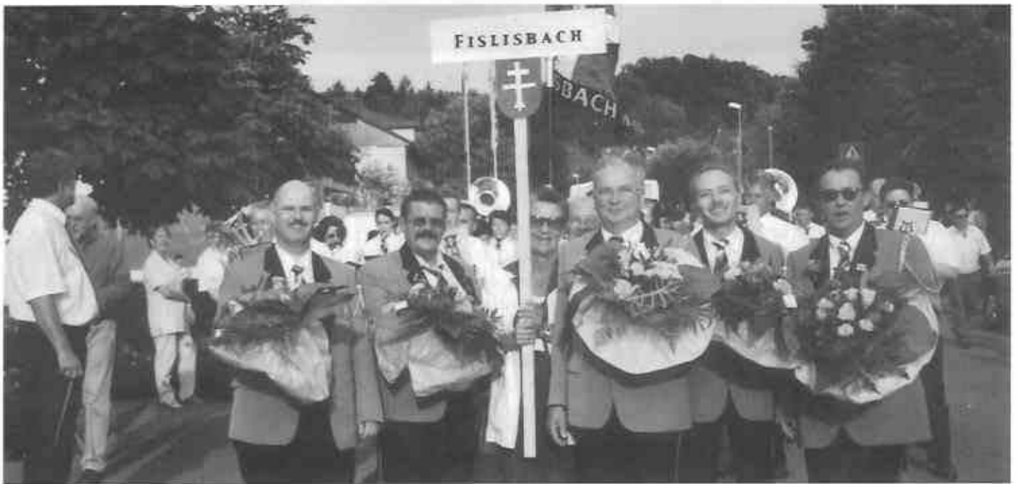
▽ Unsere glücklichen Veteranen mit Fahnen- gotte beim Eintreffen in Fislisbach.