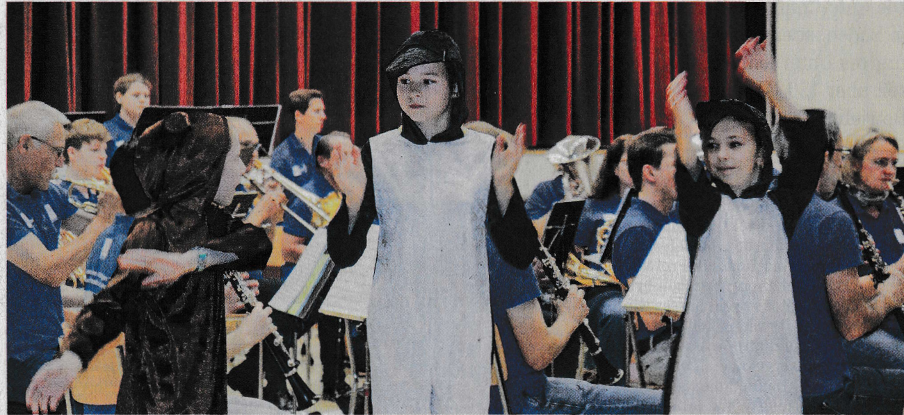
Mit dem Kinderkonzert will die Musik Fislisbach die Jüngsten neugierig auf das Musizieren machen

nen und Teilnehmer momentan pausiert, war zusätzliche Motivation, erneut zu einem Kinderkonzert zu laden und die Kinder im Dorf für die Musik zu begeistern. Diesmal ging es im Konzert in den Zoo. Weil die Zoowärterin nicht richtig abgeschlossen hatte, bückten zwei Pinguine aus ihrem Gehege aus. Unterwegs begegnen sie zahlreichen tierischen Gehegenachbarn. Mit passenden Musikstücken wie «Baby Elephant Walk» oder «Biene Maja» kamen die jungen Besucherinnen und Besucher des Kinderkonzerts während 40 Minuten auf ihre Kosten. Wer Lust hatte, durfte mittanzen. Im Anschluss durften die Kinder sich die Instrumente der Musik Fislisbach anschauen und diese teilweise ausprobieren. Das Kuchenbuffet und die Sirupbar im Freien rundeten den Anlass ab.