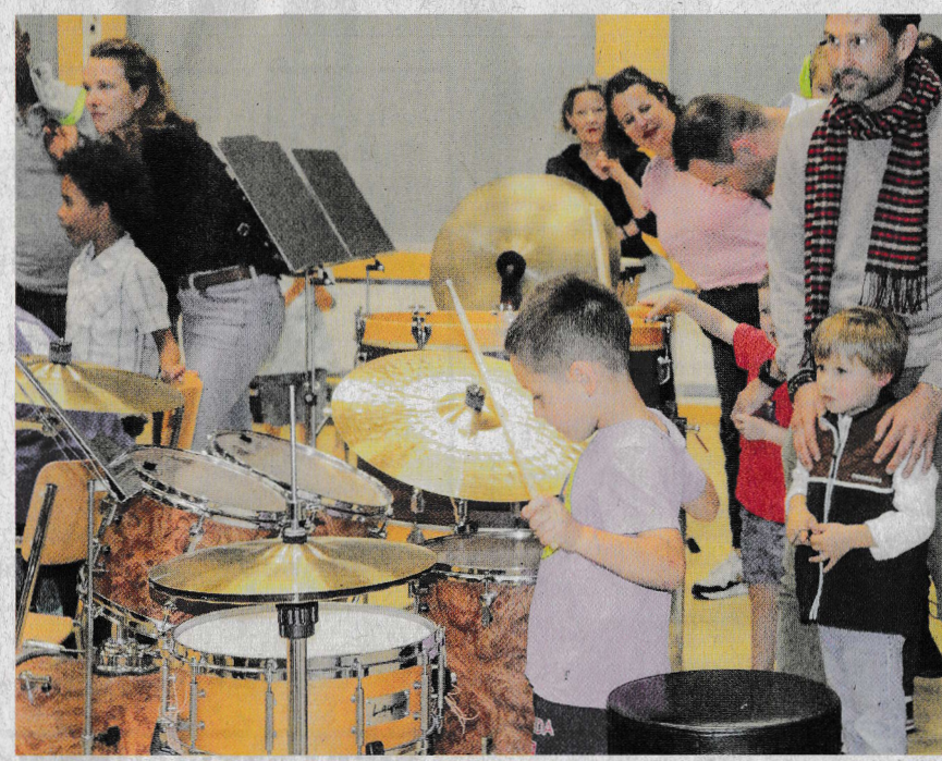
Selbst mitzuwirken, gehört beim Kinderkonzert dazu

Verschiedene Dokumente lassen darauf schliessen, dass sich in Fislisbach schon vor 1886 Musikantengruppen formiert hatten. Auch gab es in der Region, als die heutige Musikgesellschaft Fislisbach (MGF) in diesem Jahr gegründet wurde, bereits zahlreiche Musikvereine. Trotzdem zählt die MGF im Dorf selbst mit ihren 138 Jahren zu den ältesten Vereinen. Kein Wunder also, haben sich der Verein und seine Mitglieder längst als wesentlicher Bestandteil des dörflichen Gesellschaftslebens etabliert. Teil des Engagements für die Gemeinschaft ist das traditionelle Kinderkonzert für junge Musikbegeisterte. Seite 4